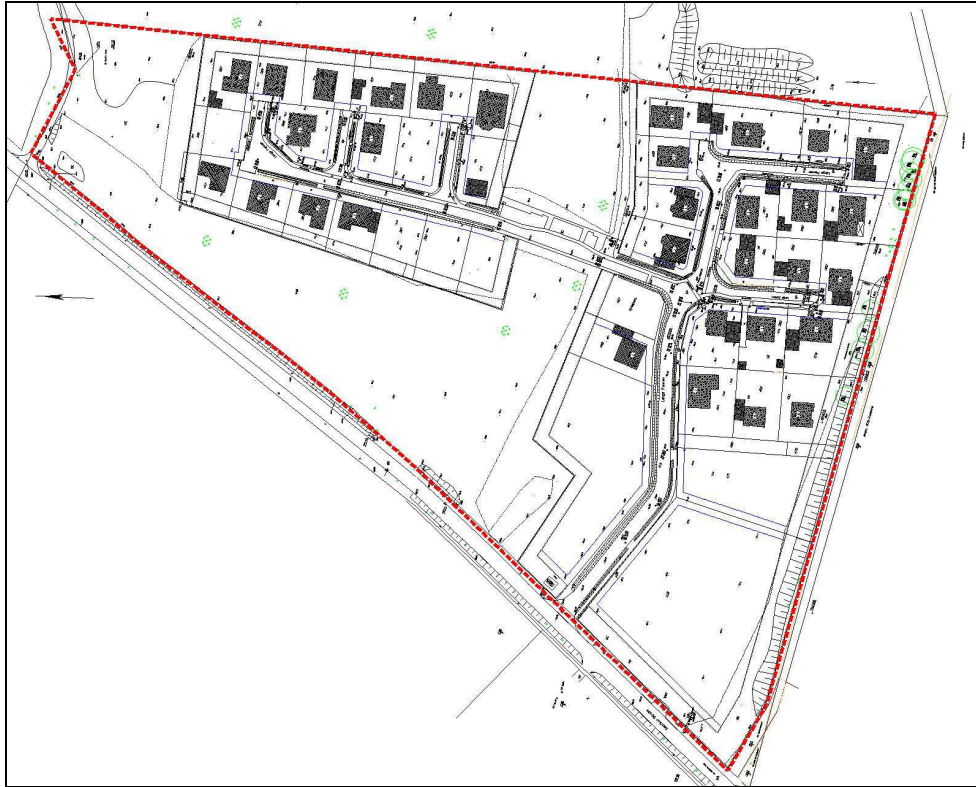
Abbildung 2: Räumlicher Geltungsbereich des B-Planes Nr. 10 „Lange Pannen“; Basis Bestandsvermessung 2015 (ohne Maßstab)