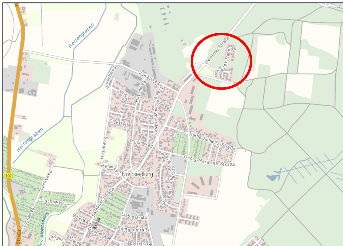
Abbildung 1: Lage des Plangebietes am nördlichen Rand der Ortslage Rathenow; Grundlage Brandenburgviewer 11/2016

Das Plangebiet befindet sich im nördlichen Teil der bebauten Ortslage der Stadt Rathenow.