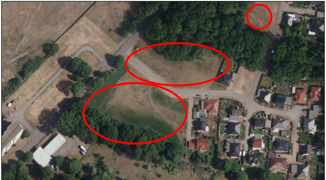
Abbildung 3: Luftbildübersicht mit Darstellung der im Geltungsbereich noch unbebauten Flächen; Basis Luftbild Brandenburgviewer 11/2017 (ohne Maßstab)

Aktuell ist im gesamten Untersuchungsgebiet eine Betroffenheit von Vogelarten die durch das Vorhaben ausgelöst werden könnte, auszuschließen.