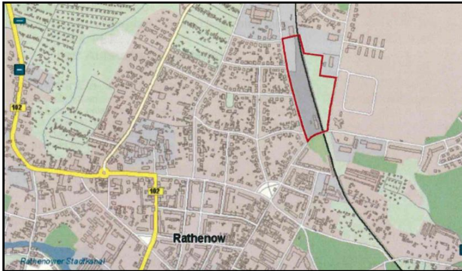
Abgrenzung des Planbereiches

Der Bebauungsplan kann einschließlich seiner Begründung im Bauamt der Stadtverwaltung der Stadt Rathenow, Berliner Str.15, Zimmer 419 während der üblichen Sprechzeiten eingesehen werden. Jedermann hat die Möglichkeit über den Inhalt Auskunft zu verlangen.